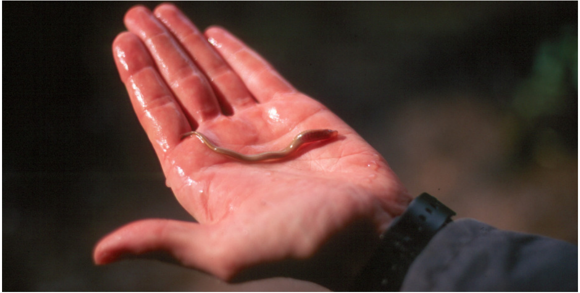
Abb. 1: Bachneunaugenlarve aus der Forellenregion der Elbe, eines Zuflusses der Eder