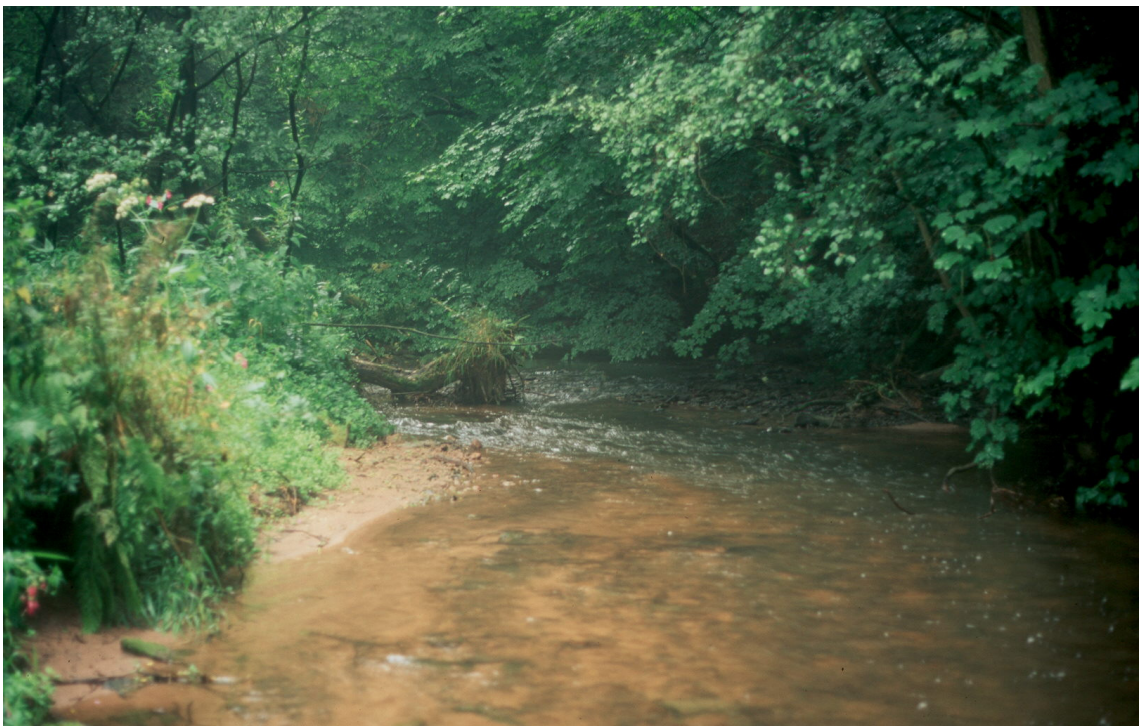
Abb. 2: Typischer Lebensraum des Bachneunauges in der Äschenregion der Fulda